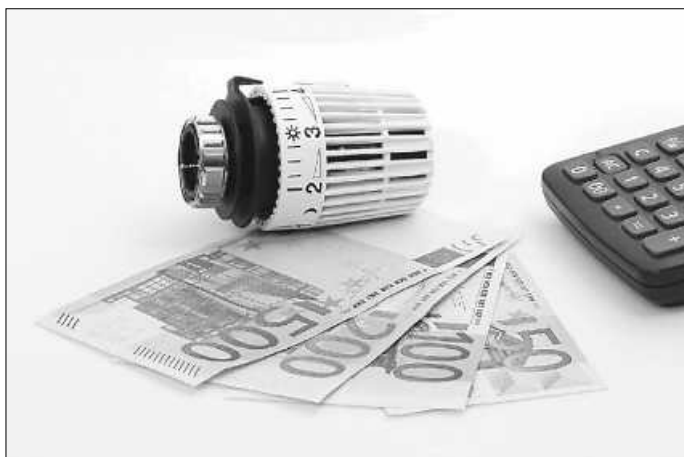
Jetzt Förderungen für den Heizungstausch sichern

Wer Fragen zur Antragsstellung, oder den unterschiedlichen Boni und Förderkonditionen hat, kann eine Energieberatung in Anspruch nehmen. Bei einem kostenlosen Erstgespräch, beantworten die Expert:innen der LEA persönlichen Fragen rund um den Heizungstausch. Termine können unter 07141 68893-0 vereinbart werden.