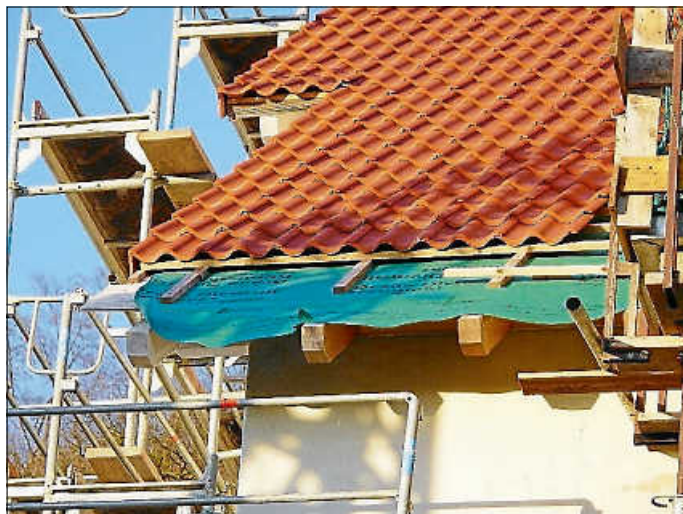
Gut gedämmt, ist halb gelüftet

Wer sich selbst oder seine Mieter:innen zukünftig vor extremer Hitze schützen möchte, kann unter 07141 688 930 einen Termin zur kostenlosen Energieberatung vereinbaren. Dort beantworten Expert:innen der LEA persönliche Fragen zum baulichen Wärme- und Hitzeschutz.