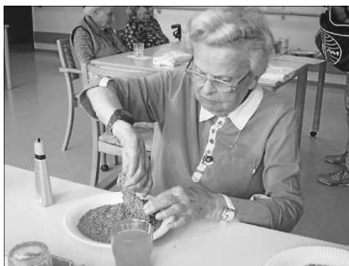
Auch wurde die Erdbeerzeit genutzt und Erdbeerquark hergestellt.