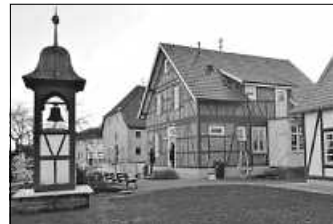
Museum und Rathaustürmle – Blick vom Garten